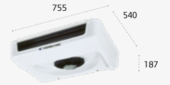
ES150 MAX ULTRAPLAT