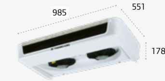
ES300/ ES300 MAX ULTRAPLAT