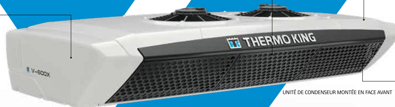
UNITÉ DE CONDENSEUR MONTÉE EN FACE AVANT