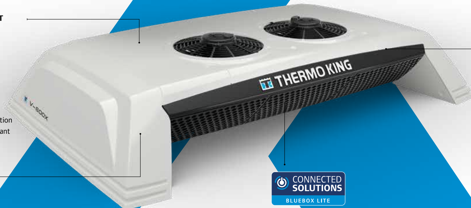
UNITÉ DE CONDENSEUR MONTÉE SUR PAVILLON