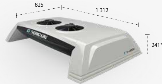
GROUPE FRIGORIFIQUE MONTÉ SUR PAVILLON V400X/500X/600X

* Les hauteurs ci-dessus correspondent à la hauteur du couvercle. Hauteurs, y compris les ventilateurs : Montage en face avant - 276 mm - Montage en pavillon - 273 mm